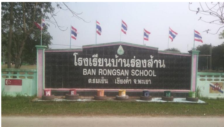
ภาพที่ 1 โรงเรียนบ้านร่องสำน สังกัดสำนักงานเขตพื้นที่การศึกษาประถมศึกษาพะเยาเขต 2

ปัจจุบันโรงเรียนบ้านร่องสำน ตำบลสร้อยหิน อำเภอเชียงคำ จังหวัดพะเยา มีนักเรียนกลุ่มชาติพันธุ์ที่เป็น ชาวเขาเผ่าม้ง ประมาณ 60% ชาวไทยเหนือ ประมาณ 20% และชาวไทยอีสาน ประมาณ 20% (ข้อมูลในปี พ.ศ.2558) ซึ่งจะเห็นได้ว่านักเรียนส่วนใหญ่ที่เข้ามาศึกษาในโรงเรียนแห่งนี้ส่วนใหญ่เป็นนักเรียนกลุ่มชาติพันธุ์ม้ง จากการสอบถามครูผู้สอนทำให้ทราบข้อมูลว่านักเรียนชาติพันธุ์ไทยเหนือและไทยอีสานส่วนใหญ่ นิยมที่จะเข้าศึกษาต่อในโรงเรียนประจำอำเภอมากกว่า เพราะผู้ปกครองของนักเรียนชาวไทยเหนือและชาวไทยอีสานส่วนใหญ่อธิว่่าค่อนข้างจะมีฐานะที่ดี